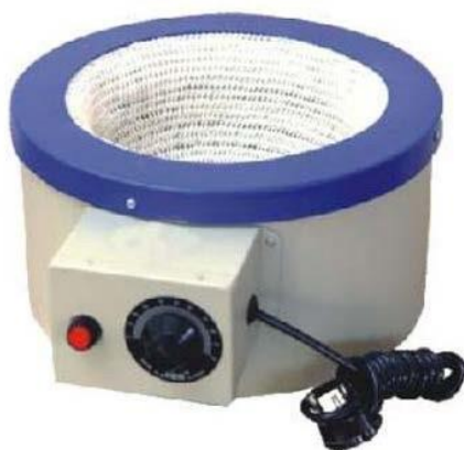
Figura 761 - 2. Calentador eléctrico de manto